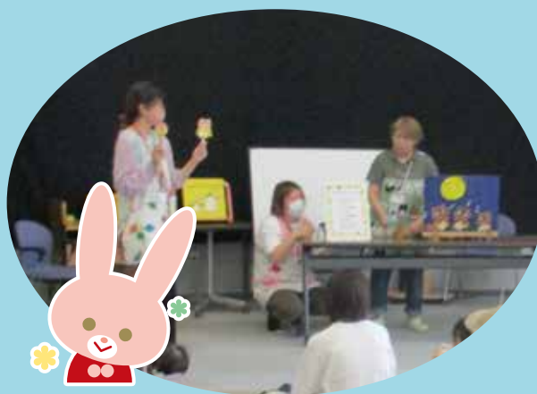
わらべ歌あそび「やすべえじい」 (子育て支援センター)

わらべ歌あそびのほか、大型絵本の 読み聞かせや、ミュージックパネル シアター、ゲーム「月見団子積み」 を行いました。