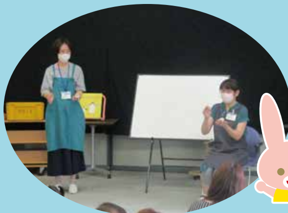
わらべ歌あそび「十五夜さんのもちつき」(図書館)