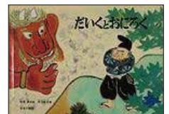
松居 直/再話 赤羽 末吉/画 (福音館書店)

昔話も好きなむすこですが、鬼が出てくる話には敏感で、この本は特に気に入っています。現代の絵本にはなかなかないような表現や、昔話ならではの話の流れが面白く、親も楽しく読んでいます。白黒とカラーのページが交互に出てくるといっても、子どもの目を引いているみたいです。鬼に向けた大工の決め台詞を、よく真似しては喜んでます。