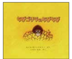
ルース・ボーンスタイン/さく いわた みみ/やく (ほるぷ出版)

やわらかいタッチで描かれた絵が気に入ったのか、よんでとよく持ってきた本です。コロコロ変わる表情が可愛い「ちびちび」と、優しい動物たちがたくさん登場する様子を、いつも真剣な顔で見聞かしていました。この本で動物の名前をたくさん覚えました。おはなしの最後と一緒に誕生日の歌を歌う流れは、今も変わらずです。