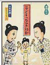
『子どもつなひき騒動』